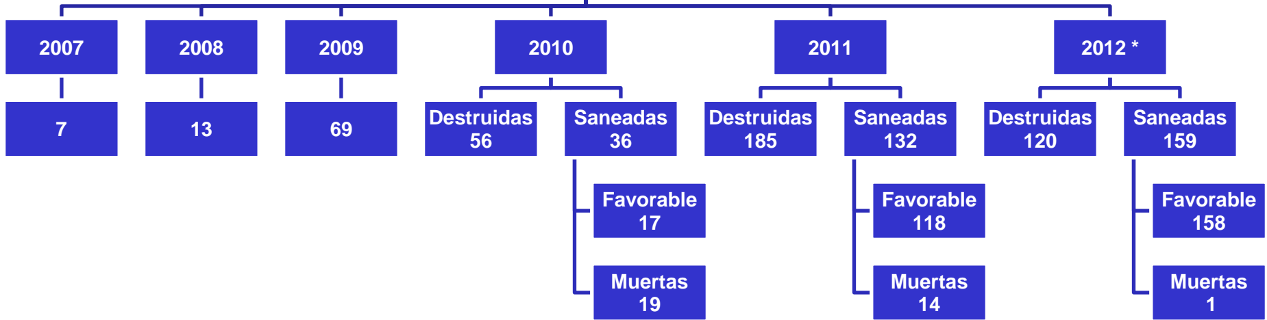
SITUACION ACTUAL: DESTRUCCIONES Y VIG INTENSIVA